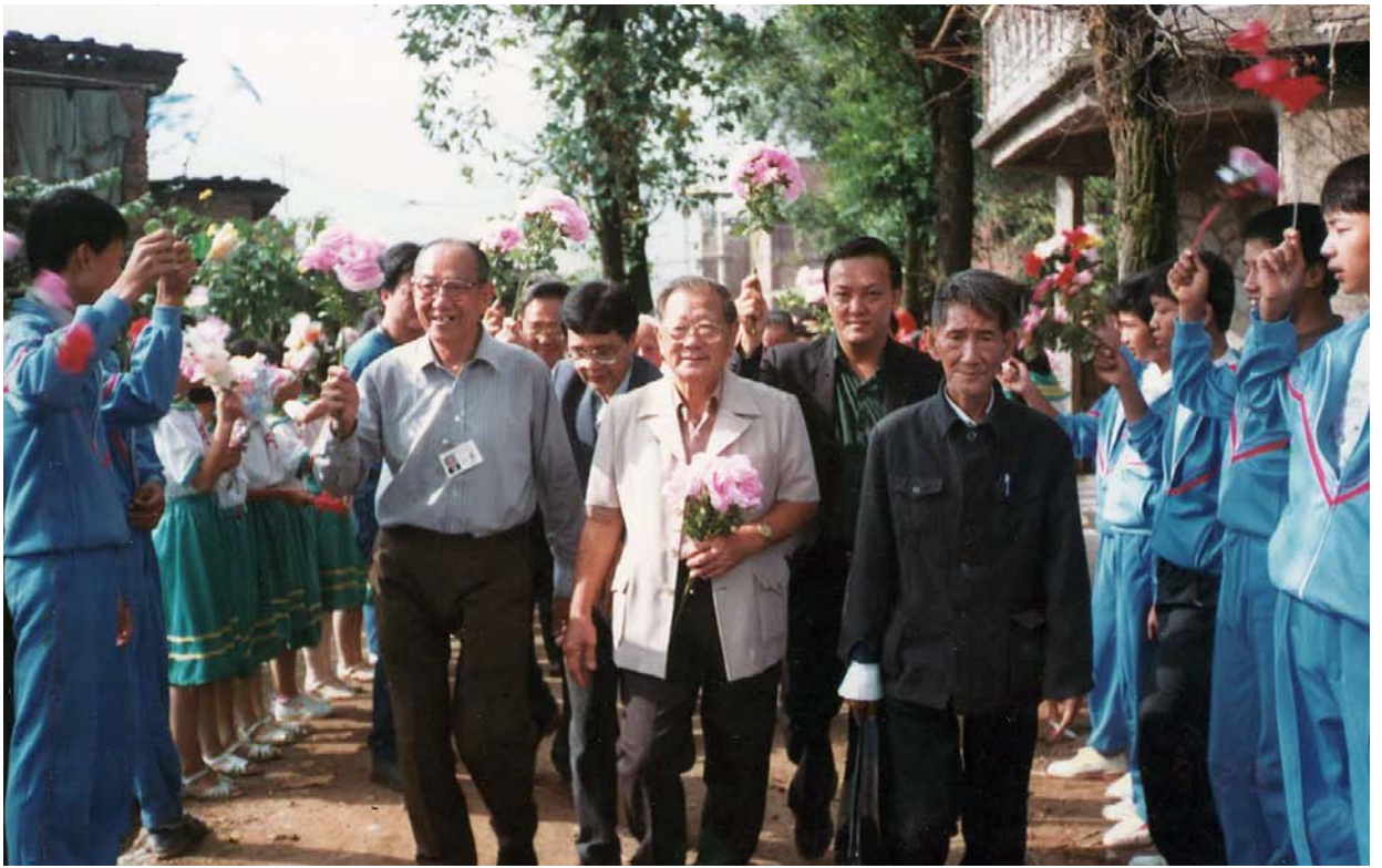
1993年9月27日首次回乡谒祖在一世祖宇 左起苍悟总務、总会長致祥、保定桃源家族会会長，后者平福、思华。