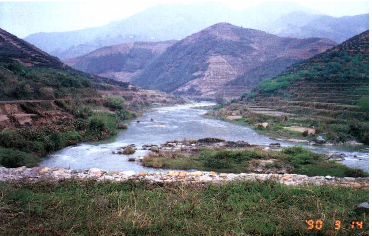
一世祖斌公墓前景